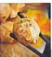
D17 山竹牛肉 5.50€ Beef ball