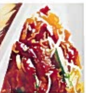
D2 干炒牛河 14.00€ Stir-fried rice noodles with beef