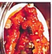
D7 凤爪 5.50€ Phoenix talons