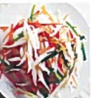
D4 银针粉 14.00€ Silver pin noodle