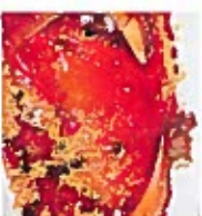
D24 避风塘炒蟹 17.00€ Typhoon shell crab