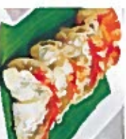
D14 煎饺子 5.50€ Gyoza