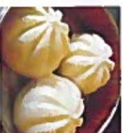
D18 鸡包仔 5.50€ Chicken bun