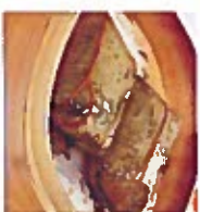
D11 糯米鸡 6.00€ Lotus leaf rice piece