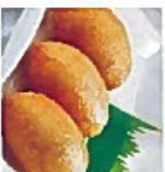
D9 叉烧包 5.50€ Baked B.B.Q pork bun