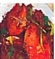
D22 椒盐蟹 16.00€ Crab with salt and pepper