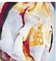
D6 肠粉 6.00€ Rice noodle rolls 叉烧 B.B.Q porc 5.50€ 虾菜 Beignet 5.50€