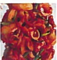
D19 煎鱿鱼 5.50€ Small grill squid