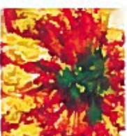
D23 蒜蓉炒虾 17.00€ Steamed shrimp with garlic