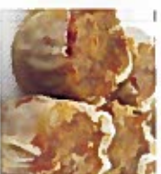
D16 牛肉烧卖 5.50€ Sui Mai beef