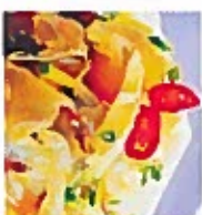
D21 凉拌蜆 12.00€ Meduse enrobé a froid