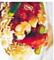
D3 海鲜炒宽面 15.80€ Seafood grill noodles