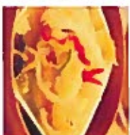
D12 姜葱牛肉 5.50€ Ginger scallion on tripe