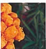
D20 虾丸 16.00€ Deep fried shrimp ball