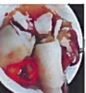
D13 蒸鱿鱼 6.00€ Small squid steamed