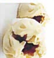
D15 叉烧包 5.50€ Steamed B.B.Q pork bun