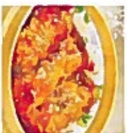
D10 豉汁卷 5.50€ Assorted meat wrapped w/bamboo sheet