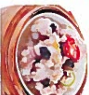
D8 豉汁排骨 5.50€ Spare ribs black beans