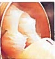
D5 虾饺 6.00€ Shrimp dumpling