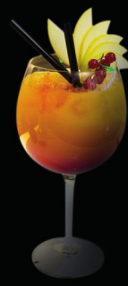
Cocktail sans alcool