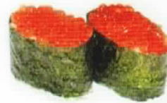
Sushi Oeufs saumon