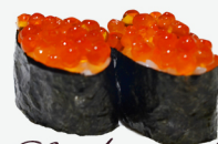
Sushi oeufs de saumon