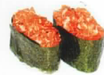
Tartare de saumon