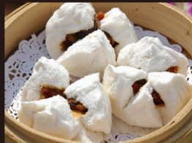
C15 Banh Bao Nhan Xa Xiu 5,50€ 叉烧包 (2 pièces) Brioches au porc rôti à la vapeur