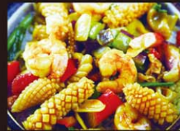
CP4 Hai Sang Tuo Song 15,80€

Poitrine de porc au Mei chou à la vapeur