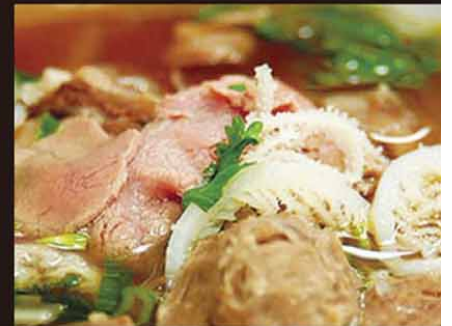
S3 Pho Thap Cam 15,80€ (grande) 特别河粉 12,80€ (petite) Soupe de nouilles special maison (boeuf saignant, boeuf cuit, boulette de boeuf, estomac de boeuf)