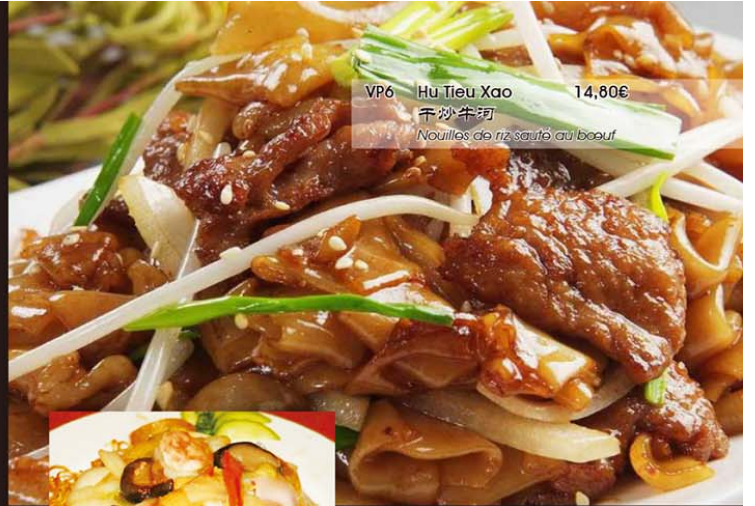
VP6 Hu Tieu Xao 14,80€ 干炒牛河 Nouilles de riz sautées au bœuf