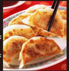
V7 Gyoza Dimsun Ga 6,80€ 鸡肉煎饺 Raviolis grillés au poulet