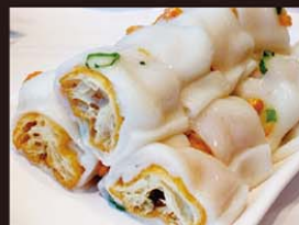
C11 Banh Cuon Dau Cha Kuan 6,00€ 炸两 Rouleaux de riz vietnamiens aux beignet chinois