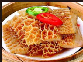
C6 La Xap Bo 5,80€ 豉汁蒸牛百叶 Étomac de bœuf au sauce haricots noirs