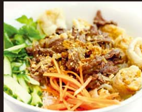
VP8 Bun Bo Cha Gio 10,80€ 越式春卷牛肉冷粉 Vermicelle vietnamienne au bœuf grillé et nêms (sans bœuf)