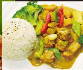
VP2 Com Ca Ri Ga 12,80€