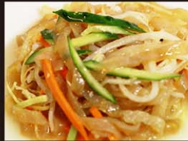
C13 Goi Sua Bien 11,80€ 凉拌海蜇 Salade de méduse