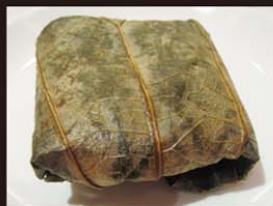
C5 Xoi Ga 6,00€ 糯米鸡 Riz gluant au poulet à la vapeur