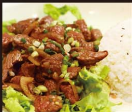
VP4 Bo Luc Lac 15,80€