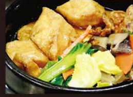
CP3 Dau Hu Chay 10,80€