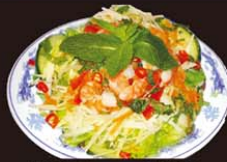
V2 Goi Tom 8,90€ (grande) 鲜虾沙拉 4,90€ (petite) Salade vietnamienne aux crevettes