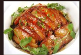
CP5 Cai Mang Trung Thit Heo 12,80€