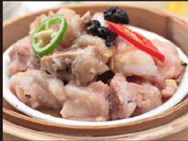
C14 Suong Non Trung Tuong 5,50€ 豉汁蒸排骨 Côtelette de porc au haricots noirs à la vapeur