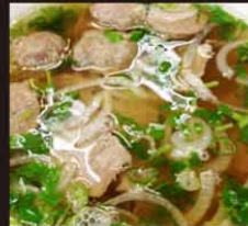
S2 Pho Bo Vien 14,80€ (grande) 牛肉丸河粉 11,80€ (petite) Soupe de nouilles vietnamiene aux boulette de boeuf