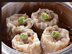
C2 Xiu Mai Heo 4,80€ 猪肉烧卖 Bouchées au porc à la vapeur