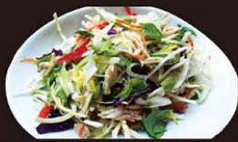
V1 Goi Ga 7,90€ (grande) 鸡肉沙拉 4,50€ (petite) Salade vietnamienne au poulet