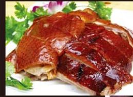
CP1 Vit Quay 13,80€