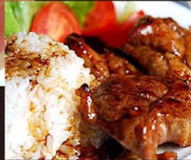
VP3 Com Xuong 12,80€