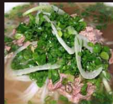
S1 Pho Tai 14,80€ (grande) 生牛肉河粉 11,80€ (petite) Soupe de nouilles vietnamiene au boeuf saignant