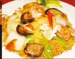
VP7 Mixao Gion Thop Cam 16,80€ 海鲜炸厥面 Nouilles croustillant vietnamien aux fruits de la mer