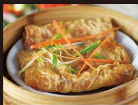
C4 Dau Hu ki Bachhoa 5,50€ 鲜竹卷 Rouleaux de feuille de tofu à la vapeur