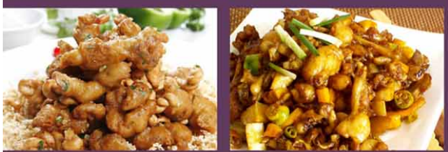
CP7 椒盐田鸡 13,80€ Cuisse de grenouille au sel et poivre