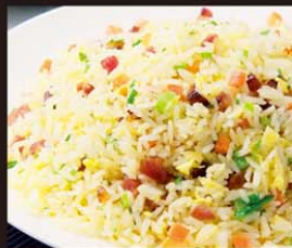
VP5 Com Chien Duong Chau 11,80€