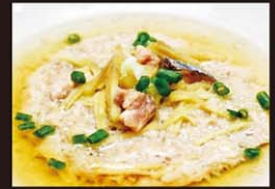
CP6 Ca Mang Trung Thit Heo 12,00€