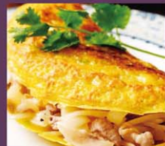
V5 Banh Xeo 8,80€ 越南薄饼 Crêpe vietnamienne aux porc et crevettes