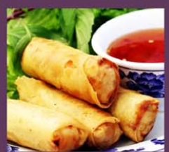
V4 Cha Gio 6,80€ 越南春卷 Nêms croustillants au porc