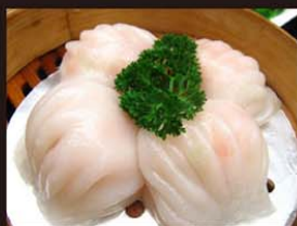
C1 Ha Kao 5,50€ 虾饺 Ravioles aux crevettes à la vapeur