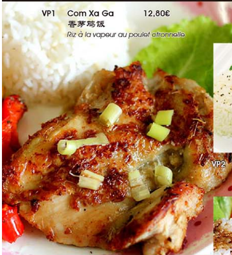
VP1 Com Xa Ga 12,80€