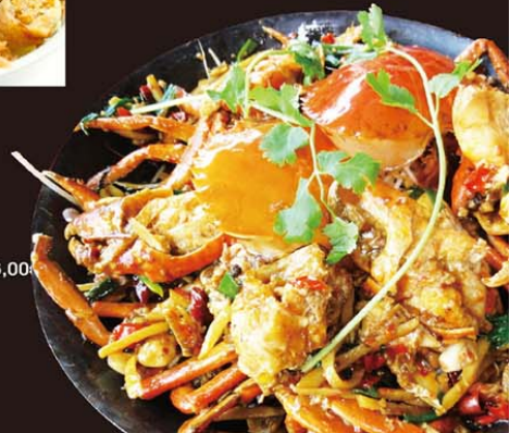
VP9 Cun Rang Me 18,00€ 越式酸梅蟹 Crabe sauté au prune façon vietnamienne