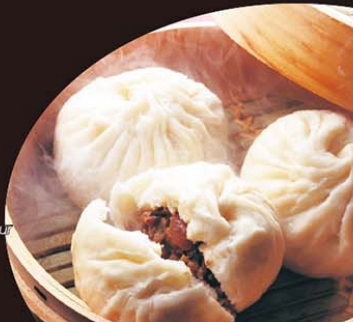
C16 Banh Bao Thit 6,00€ 大肉包 (1 pièce) Grande brioche au porc à la vapeur