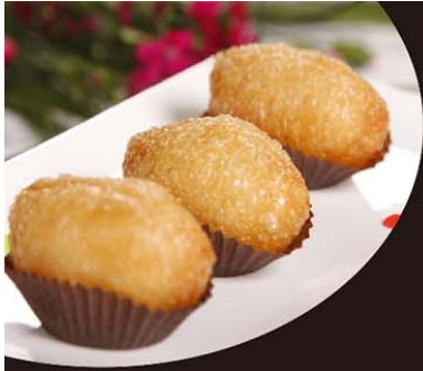
C12 Banh Xep Thit Chien 6,50€ 咸水角 Beignets de porc et légume varié