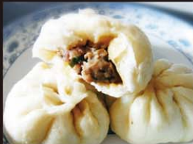
C16 Banh Bao Nhan Ga 5,50€ 鸡肉包 (2 pièces) Brioches au poulet à la vapeur