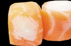
84 Saumon roll cheese Salmon roll cheese (4, 7) 6,80 €

Riz & poisson enroulés dans une fine tranche de saumon frais Rice and fish wrapped in thin slice fresh salmon