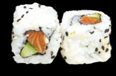
40 Saumon spicy (saumon & concombre) Salmon spicy (salmon & cucumber) (1, 3, 4, 10, 11) 5,80 €