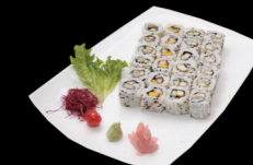
6 pièces California chicken spicy, 6 pièces California tempura, 6 pièces California nems, 6 pièces California Thon cuit & pomme vert 6 California chicken spicy, 6 California tempura, 6 California nems, 6 California cooked tuna and green apple