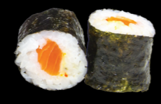
21 Saumon piquant Salmon spicy (1, 3, 4, 10, 11) 4,30 €