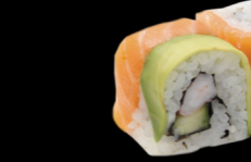
93 Queen (crevette, concombre, sauce piquante enroulés de saumon et avocat) Queen (Shrimp, cucumber, spicy sauce wrapped salmon and avocado) (1, 2, 3, 4, 10, 11) 7,30 €