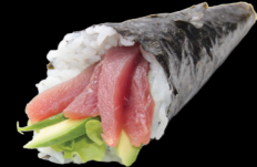
2 Thon avocat Tuna avocado (4) 5,30 €