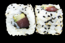
41 Thon spicy (thon & concombre) Tuna spicy (tuna & cucumber) (1, 3, 4, 10, 11) 5,80 €