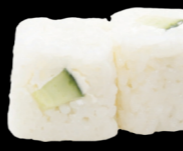
54 Concombre cheese Cucuber cheese (7) 4,30€