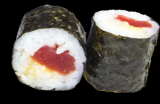
23 Thon piquant Tuna spicy (1, 3, 4, 10, 11) 4,80 €