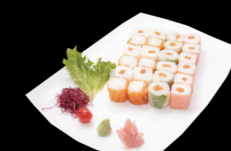
6 pièces Soja roll saumon cheese, 6 pièces Saumon roll cheese, 6 pièces Rice roll Saumon cheese, 6 pièces Printemps roll saumon cheese 6 Soja roll salmon cheese, 6 Salmon roll cheese, 6 Rice roll Salmon cheese, 6 Spring roll Salmon cheese