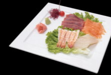
72 Assortiment (4 thon, 4 saumon, 4 crevette et 4 dorade) Assortiment (4 tuna, 4 salmon, 4 shrimp and 4 dorade) (2, 4) 17,50 €