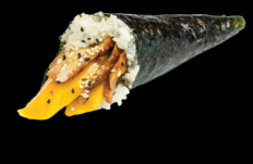
5 Anguille mangue Eel mango (1, 4, 6) 5,80 €