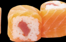
86 Saumon roll thon Salmon roll tuna (4) 7,30 €