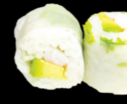
62 Crevette (crevette, avocat, menthe et coriandre) Shrimp (Shrimp, avocado, mint and coriander) (2) 6,30 €