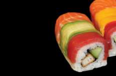
91 Rainbow (poulet, concombre, sauce piquante enroulés de thon, saumon, dorade, avocat et mangue) Rainbow (Chicken, cucumber, spicy sauce wrapped tuna dorade, salmon, avocado and mango) (1, 3, 4, 10, 11) 7,80 €