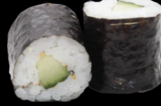
24 Concombre Cucumber (11) 3,80 €