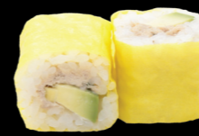
79 Thon cuit & avocat Cooked tuna & avocado (1, 3, 4, 6, 10, 11) 5,30 €