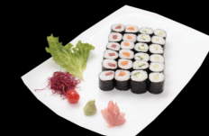
6 pièces Maki saumon, 6 pièces Maki thon, 6 pièces Maki concombre, 6 pièces Maki avocat 6 Maki Salmom, 6 Maki Tuna, 6 Maki cucumbre, 6 Maki avocado