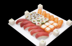
6 pièces Sushi saumon, 6 pièces Sushi thon, 6 pièces Saumon roll cheese, 6 pièces Rice roll concombre cheese, 6 pièces Printemps roll thon avocat, 6 pièces California saumon avocat 6 Sushi salmon, 6 Sushi tuna, 6 Salmon roll cheese, 6 Rice roll cucumber cheese, 6 Spring roll tuna avocado, 6 California slamon accado