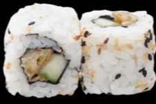
43 Nems spicy (nems & concombre) Nems spicy (nems & cucumber) (1, 3, 6, 10, 11) 5,80 €