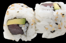
34 Thon avocat Tuna avocado (4, 11) 5,30 €