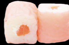
77 Saumon & cheese Salmon & cheese (3, 4, 6, 7) 5,30€

Riz & poisson enroulés dans une feuille à base de soja Rice and fish wrapped in a sheet soy