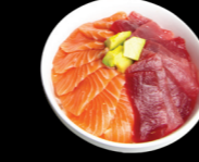
48 Mixte 8 thon & 8 saumon Mixed 8 tuna & 8 salmon (4, 11) 16,50 €