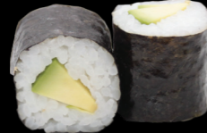
26 Avocat Avocado 3,80 €