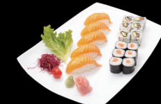
5 pièces Sushi Saumon, 6 pièces Maki saumon, 6 pièces California saumon avocat 5 Sushi Salmon, 6 Maki Salmom, 6 California Salmon avocado