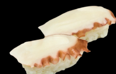
17 Poulpe Octopus 3,80 €