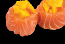
Saumon et tartare de mangue (4) 7,00 €