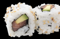
33 Saumon avocat Salmon avocado (4, 11) 5,30 €

Maki inverse avec riz à l'extérieur Maki reverse with rice on the outside