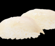
13 Dorade Dorade (4) 3,80 €