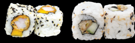
42 Tempura (scampis frits, mangue et sauce piquante) Tempura (fried scampi, mango and spicy sauce) (1, 2, 3, 10, 11) 5,80 €