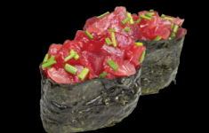
11 Tartare de Thon Tuna Tartare (4) 4,80 €