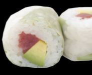
61 Thon (thon, avocat, menthe et coriandre) Tuna (Tuna, avocado, mint and coriander) (4) 6,80 €