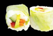
65 Végétarien (avocat, poivron, concombre & carotte) Vegetarian (Avocado, pepper, cucumber and carrot) 5,30 €