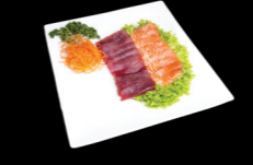
71 Mixte 8 thon & 8 saumon Mixed 8 tuna & 8 salmon (4) 17,00 €