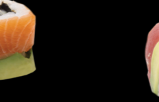
94 King (crevette, concombre, sauce piquante enroulés de thon et avocat) King (Shrimp, cucumber, spicy sauce wrapped tuna and avocado) (1, 2, 3, 4, 10, 11) 7,30 €