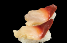
18 Hokkigai Hokkigai 6,00 €