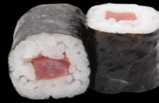
22 Thon Tuna (4) 4,80 €