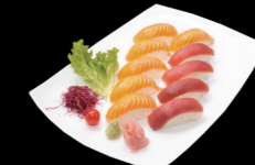
6 pièces Sushi Saumon, 4 pièces Sushi Thon (ou 10 pièces Sushi Saumon) 6 Sushi Salmon, 4 Sushi Tuna (or 10 Sushi Salmon)