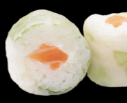
60 Saumon (saumon, avocat, menthe et coriandre) Salmon (Salmon, avocado, mint and coriander) (4) 6,30 €

Riz et poisson enroulés dans une feuille de riz et de laitue Rice and fish wrapped in rice paper and lettuce