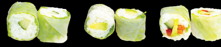
63 Concombre (concombre & cheese) Cucumber (Cucumber & cheese) (7) 5,30 €