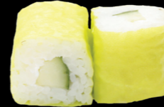
78 Concombre & cheese Cucumber & cheese (3, 6, 7) 4,80€