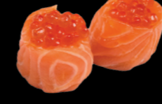
Saumon et œuf de saumon (4) 7,00 €