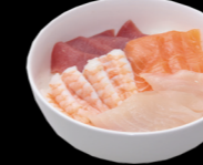
49 Assortiment (4 thon, 4 saumon, 4 crevette et 4 dorade) Assortiment (4 tuna, 4 salmon, 4 shrimp and 4 dorade) (2, 4, 11) 16,00 €