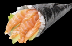
1 Saumon avocat Salmon avocado (4) 4,80 €

Cornet d'algues de riz et de poisson Hand roll seaweed rice and fish