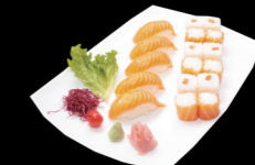
5 pièces Sushi Saumon, 6 pièces Saumon roll cheese, 6 pièces Rice roll Saumon cheese 5 Sushi Salmon, 6 Salmon roll cheese, 6 Rice roll Salmon cheese