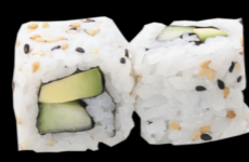
37 Concombre avocat Cucumber avocado (11) 4,80 €