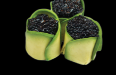
Avocat et œuf de poisson noir (4) 6,00 €