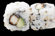
39 Chicken spicy (poulet & concombre) Chicken spicy (chicken & cucumber) (1, 3, 10, 11) 5,80 €