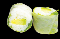
64 Avocat (Avocat & cheese) Avocado (Avocado & cheese) (7) 5,30 €