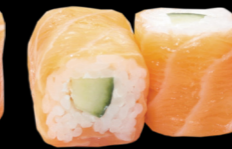
85 Saumon roll cheese concombre Salmon roll cheese cucumber (4, 7) 7,30€