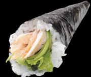
3 Crevette avocat Shrimp avocado (2) 4,80 €