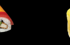
92 Mango (poulet, concombre, sauce piquante enroulés de mangue) Mango (Chicken, cucumber, spicy sauce wrapped mango) (1, 3, 4, 10, 11) 7,30 €