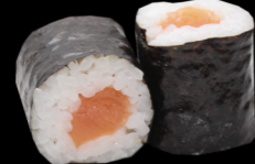
20 Saumon Salmon (4) 4,30 €

Riz et poisson enroulés dans une feuille d'algues Rice and fish wrapped in a nori seaweed sheet