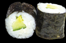
25 Concombre cheese Cucumber cheese (7) 3,80 €