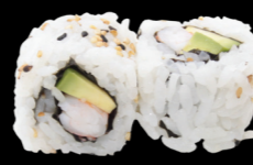
35 Crevette avocat Shrimp avocado (2, 11) 5,30 €