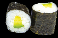
27 Avocat cheese Avocado cheese (7) 3,80 €