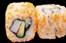
36 Surimi avocat Surimi avocado (1, 2, 3, 4, 6) 5,30 €