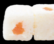
53 Saumon cheese Salmon cheese (4, 7) 4,80€

Poisson cru enroulé de riz vinaigré Raw fish wrapped in rice vinegar