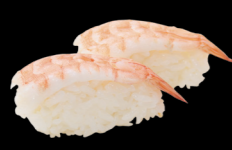
12 Crevette Shrimp (2) 4,30 €