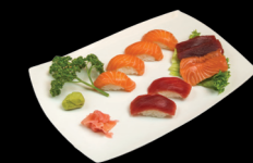
4 pièces Sushi saumon, 6 pièces California saumon avocat, 5 pièces Sashimi Saumon 4 Sushi Salmon, 6 California Salmon avocado, 5 Sashimi Salmon