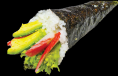
4 Surimi avocat Surimi avocado (1, 2, 3, 4, 6, 12) 4,80 €