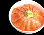
47 Saumon Salmon (4, 11) 15,00 €

Tranches de poisson cru dans un bol de riz vinaigré Sliced raw fish in a bowl of vinegared rice