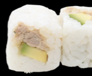
55 Thon cuit avocat Cooked tuna avocado (1, 3, 4, 6, 10, 11) 4,80€