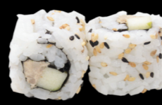
38 Thon cuit pomme vert Cooked tuna apple (1, 3, 4, 6, 10, 11) 5,30 €