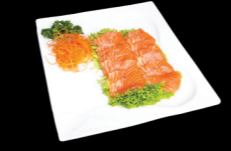
70 Saumon Salmon (4) 16,50 €

Fines tranches de poisson cru Thin slices of raw fish