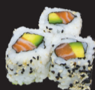
1033 (4,11) California saumon avocat