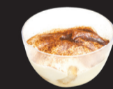
153 (3,7) Tiramisu