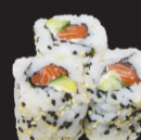
1040 (1,3,4,10,11) California saumon spicy