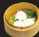
132 (1,2) Ravioli de crevette à la vapeur