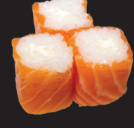
1084 (4,7) Saumon roll cheese