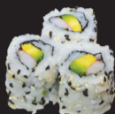
1035 (1,2,4,6,12) California crevette avocat