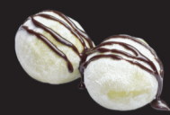
156 (1,3,5,8,11) Mochi glacé au thé vert matcha +1€