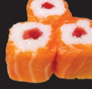
1086 (4) Saumon roll thon