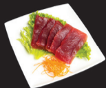
1073 (4) Sashimi thon +2,50€