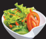
104 (3,10) Salade