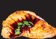
126 (4,6) Saumon grillé