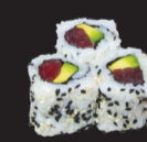
1034 (4,11) California thon avocat