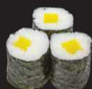
1028 Maki radis jaune