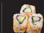
1036 (1,2,3,4,6,12) California surimi avocat