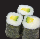
1027 (7) Maki avocat & cheese