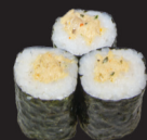
1029 (1,3,4,6,10,11) Maki thon cuit