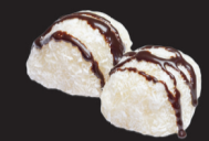
157 (1) Perles de coco +1€