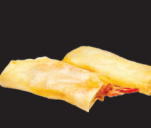
125 (1,2,3) Scampis frits