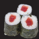
1022 (4) Maki thon