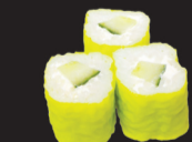
1078 (3,6,7) Soja roll concomre & cheese