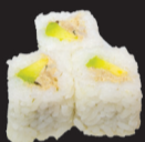
1055 (1,3,4,6,10,11) Rice roll thon cuit & avocat