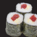
1023 (1,3,4,10,11) Maki thon piquant