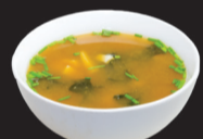
100 (4,6) Soupe miso