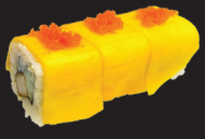
1092 (1,2,3,4,10,11) Mango