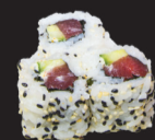
1041 (1,3,4,10,11) California thon spicy