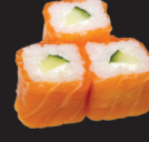
1085 (4,7) Saumon roll concomre & cheese