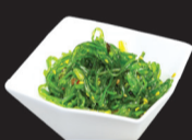
102 (1,6,11) Salade d'algues