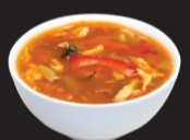
101 (1,3,6) Potage au poivre oriental