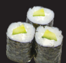
1025 (7) Maki concom- re & cheese