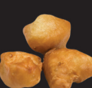
124 Beignets de poulet frits