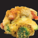
123 Légumes frits