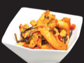
103 (1,4,6,11) Salade de calamars