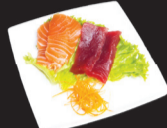
1071 (4) Sashimi mixte thon & saumon +2€