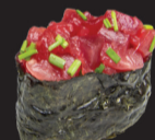
1011 (4) Sushi tartare thon