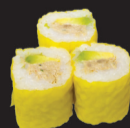
1079 (1,3,4,6,10,11) Soja roll thon cuit & avocat