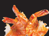
127 (2,6) Scampis grillés