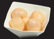
154 Salade de fruits