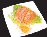
1070 (4) Sashimi saumon +1,50€