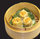
133 (1,2,3,4,14) Sao Mai (porc)