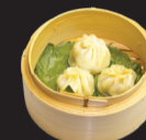
134 (1,3,6,14) Brioche de porc à la vapeur