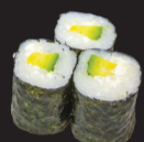
1026 Maki avocat