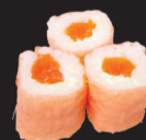
1077 (3,4,6,7) Soja roll sau- mon & cheese