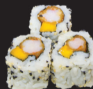
1042 (1,2,3,6,10,11) California tempura