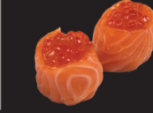
1087 Tulipe aux œufs de saumon